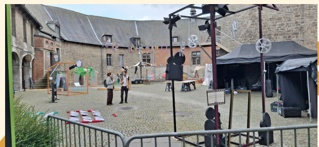
Décorés créés par des enfants lors d'atelier du CEC d'Ath à l'occasion du festival Sortilège, 14/05/2026

Ces cours ont une valeur qui dépasse largement leur contenu technique. Ils développent la créativité, la confiance en soi, la capacité à travailler en équipe et à s'exprimer autrement que par les mots. Ils permettent à des enfants qui peinent en mathématiques ou en français de trouver leur voix, de briller différemment, de se découvrir.