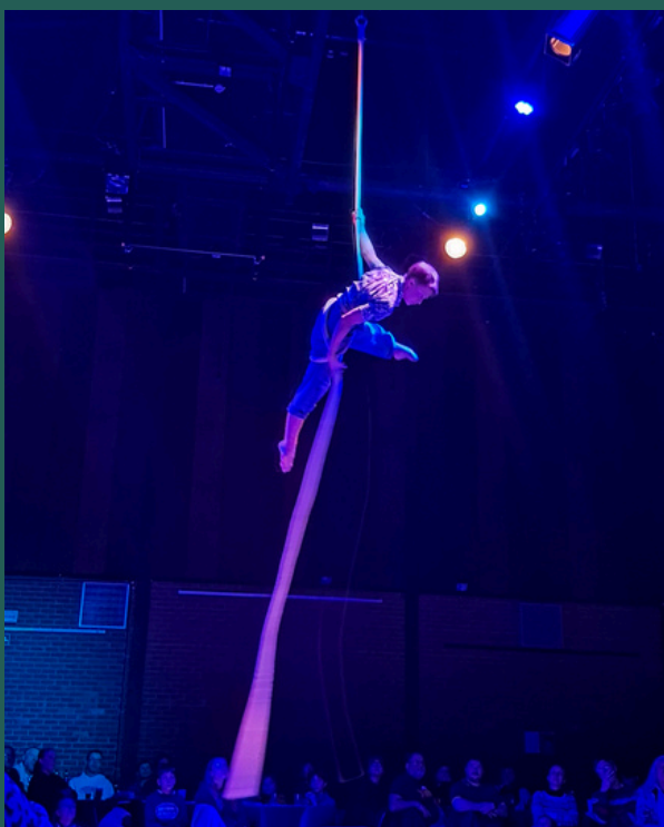
Cabaret de l'école de cirque Ball'istik, 17/01/2026

Les arts de la scène : Le théâtre, la danse, l'opéra, le cirque, la comédie musicale... Les arts de la scène regroupent toutes les formes d'expression qui se vivent en direct, devant un public.