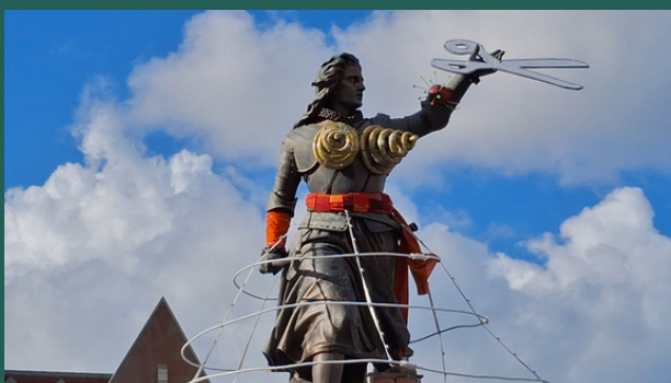
Statue de Christine de Lalaing habillée à l'occasion du carnaval, Tournai, 14/03/2026

La culture hors les murs : Mais la Culture ne se limite pas à ces lieux. Elle se trouve partout, souvent là où on ne l'attend pas. On en trouve dans la rue avec le street art, comme à Louvain-la-Neuve, où des œuvres murales se découvrent aux quatre coins de la ville, transformant chaque promenade en visite d'exposition. On peut notamment en retrouver sur les murs du cinéma, des auditoriums, et de la gare. On la trouve avec les concerts de rue et les festivals qui s'installent dans les places publiques et font vibrer des quartiers entiers le temps d'une journée ou d'un week-end, comme le festival Sortilège à Ath le jour de l'Ascension.