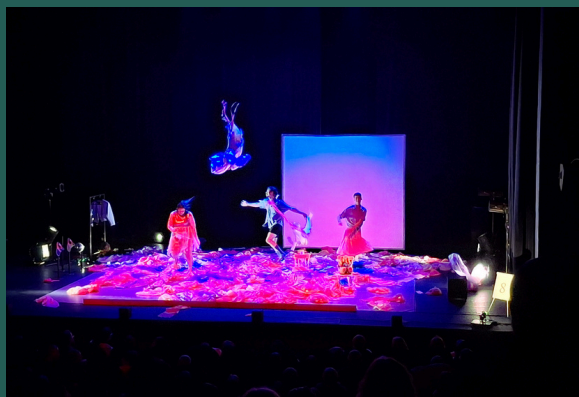
Spectacle Norman, Palace, Ath, 17/03/2026

Les lieux traditionnels : Bien sûr, il existe les lieux plus classiques, plus institutionnels. On pense notamment aux musées, aux bibliothèques, aux théâtres, aux galeries d'art, aux cinémas, aux salles de concert ou encore aux centres culturels. Ces espaces ont été pensés et construits pour accueillir la culture, la conserver, la diffuser et la partager. Ils jouent un rôle essentiel dans la préservation du patrimoine et la démocratisation de l'accès aux œuvres. Mais ils sont parfois « menaçants » pour certaines personnes qui n'ont pas l'habitude de s'y rendre.