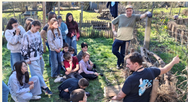
Mise en action d'un projet sur le bien-être animal, 02/03/2026

Jeunes et Citoyens Primaires est un projet porté par l'équipe d'animation générale et intensifiée de la Maison Culturelle d'Ath, qui accompagne des élèves de 5e et 6e primaire dans la réflexion, puis la réalisation d'actions citoyennes concrètes. Il s'étale sur une année scolaire complète, de la première phase de réflexion en octobre jusqu'à la journée de valorisation en juillet.