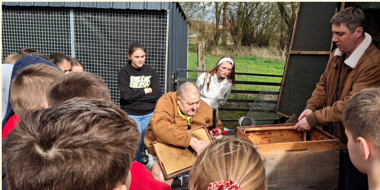
Rencontre avec un apiculteur, 16/03/2026

Jeunes et Citoyens Primaires est, à mes yeux, un modèle de ce que la médiation culturelle peut accomplir quand elle est pensée avec soin, conviction et respect pour ses publics.