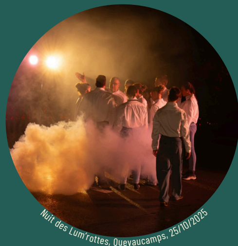
Nuit des Lum'rottes, Quevaucamps, 25/10/2025

Les arts de la rue : Le street art, le graff, le cirque, le théâtre de rue, la danse urbaine, les performances publiques... Les arts de la rue ont cette particularité de s'inviter dans l'espace public. Ils rendent la culture accessible à tous, sans billet d'entrée, sans code vestimentaire, sans seuil à franchir. Ils interrogent, surprennent, embellissent le quotidien. Des œuvres emblématiques de Banksy aux fresques collaboratives dans nos villes, ils transforment l'espace urbain en galerie à ciel ouvert. Il est même parfois mis en valeur dans des événements tel que le festival Sortilège, Art et vous organisé par la Maison Culturelle d'Ath.